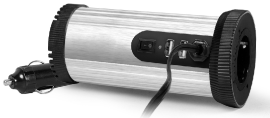
EG-PWC150-01 12 V CAR POWER INVERTER, 150 W